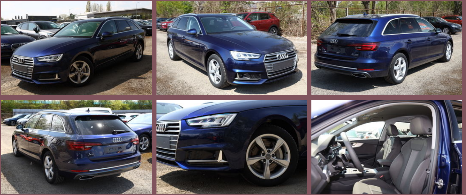
Beispielbilder - zeigen evtl. aufpreispflichtige Extras