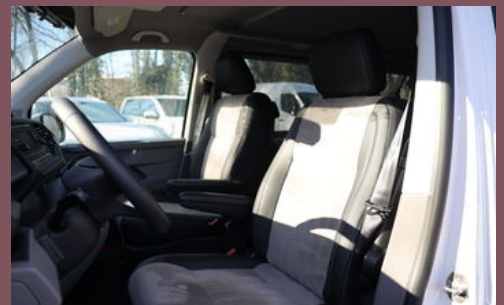
Beispielbilder - zeigen evtl. aufpreispflichtige Extras