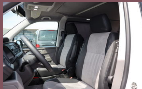
Beispielbilder - zeigen evtl. aufpreispflichtige Extras