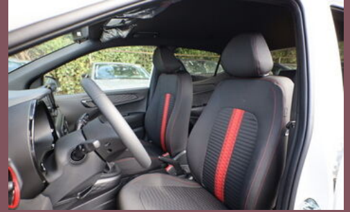
Beispielbilder - zeigen evtl. aufpreispflichtige Extras