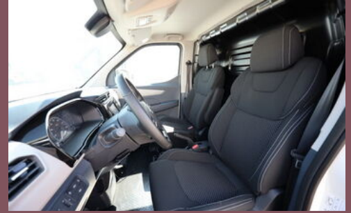
Beispielbilder - zeigen evtl. aufpreispflichtige Extras